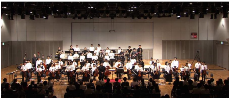
2023年8月サマーコンサート2023より(アクロス福岡イベントホール)