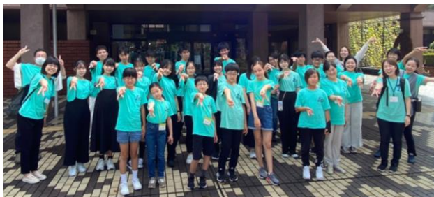
2023年9月ミュージックキャンプより(熊本県立劇場)