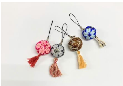
柳川まりストラップ作り