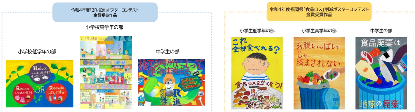
令和4年度受賞者作品

「食品ロス」を減らすための取り組みへの関心や理解を深め、大切な食料資源を無駄にしない心を育むために、県内の小中学生を対象にポスターコンテストを実施しています。ポスター制作を通して食品ロスについて考えるメッセージから、改めて環境問題について見直してみませんか。