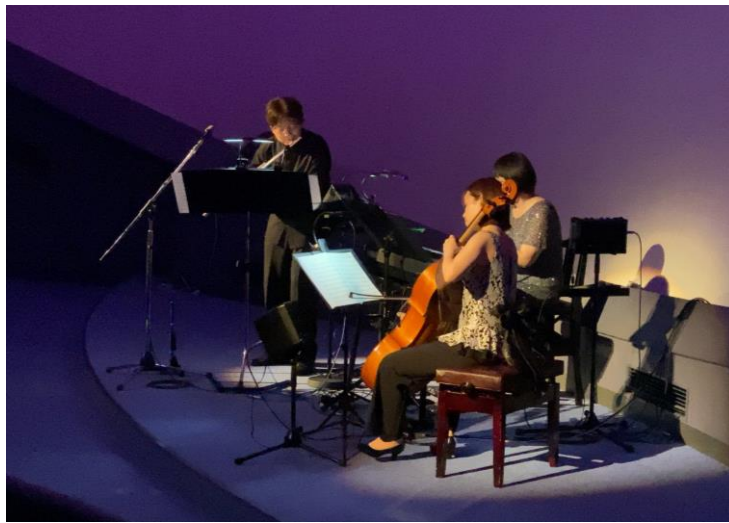
2023.7.1 アクロス・ミュージアムコンサート in 福岡県青少年科学館 より

今回は、プラネタリウムと音楽を同時に楽しめるコンサートを福岡県青少年科学館にて開催いたします。