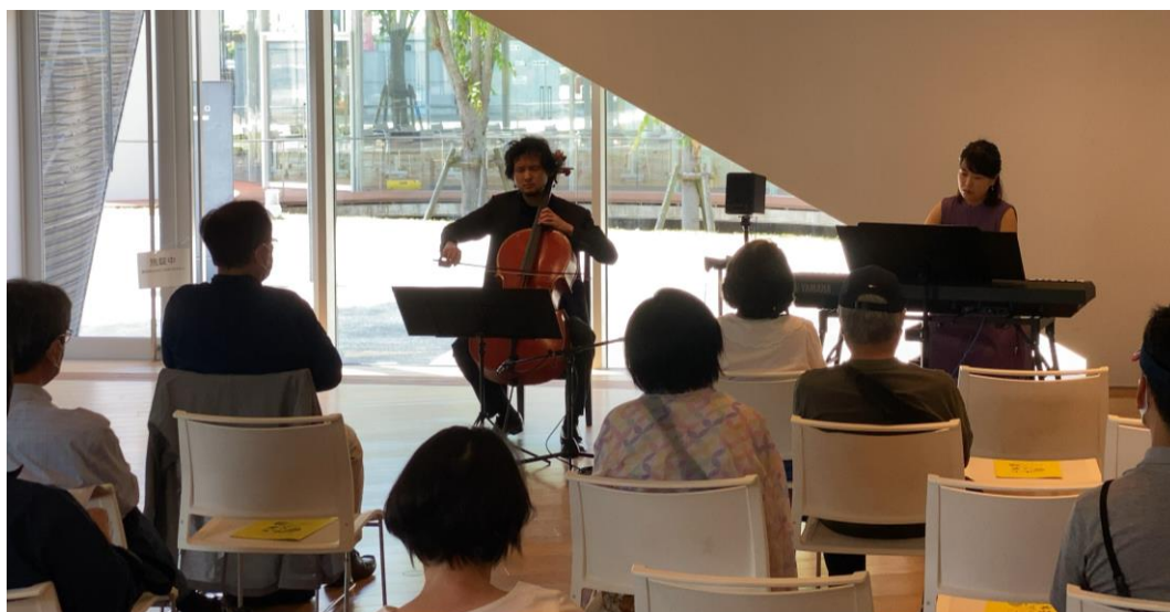
令和5年度 アクロス・ミュージアムコンサート in 九州芸文館 より

今回は、那珂川市図書館のリニューアルオープンを記念して親子で楽しむコンサートを開催いたします。