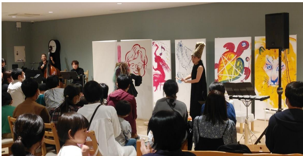
令和4年度 アクロス・ミュージアムコンサート より

アクロス・ミュージックキャラバンは、文化活動の活性化を目的に、アクロス福岡が県内の美術館、博物館、科学館等のミュージアムや、市町村と連携して開催するコンサートです。 今回は、アートと音楽を同時に楽しめるコンサートを大牟田市ともだちや絵本美術館にて開催いたします。