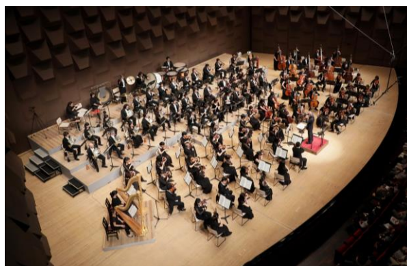
大阪フィルハーモニー交響楽団