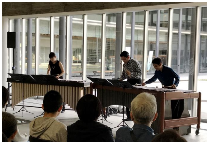
過去のミュージアムコンサート(九州歴史資料館)より