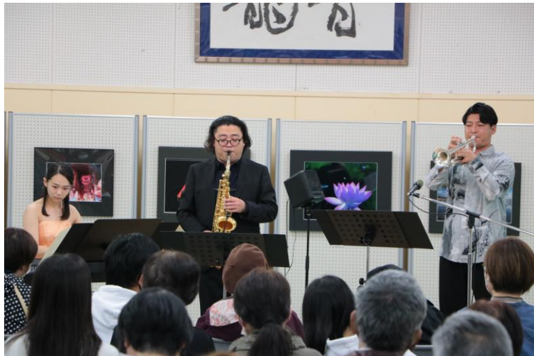
令和 4 年度アクロス・ミュージックキャラバンより