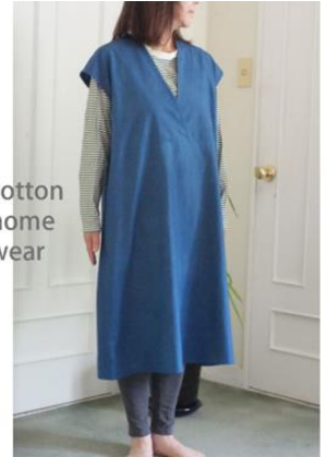
cotton home wear

テキスタイル長尾は、リネンやオーガニックコットンなどの天然素材を使って、現代の暮らしに映えるおしゃれで素敵なテキスタイルアイテムを創り続けています。本企画展では、しなやかで肌に優しい質感を持ち、優雅で奥深い光沢があるアイリッシュユリネンや、軽くて、撥水性、通気性があるアイスランディックウールなどの上質な素材を使った、カラフルでモダンなテイストの服やバック、テーブルウェアなどを展示販売します。ワンピースやストール、キッチンアイテムやインテリアなどを中心とした、秋・冬を過ごすのにぴったりな作品をぜひご覧ください。(約200点展示)