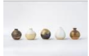
高取七絵作 野花挿し