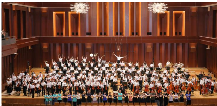
▲2024年8月北部九州ジュニアオーケストラ・フェスティバルより (福岡シンフォニーホール)