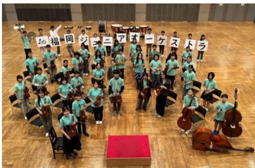
▲11月合奏練習の合間に集合写真撮影 (アクロス福岡 イベントホール)