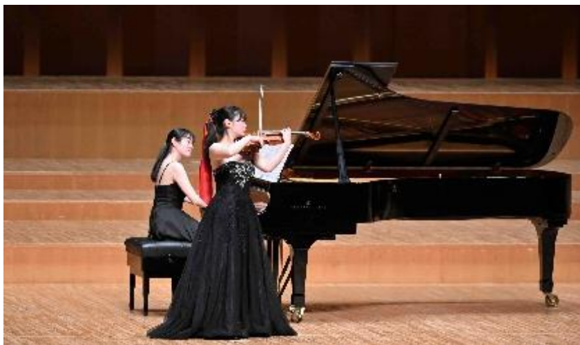
【過去のスプリングコンサートより】