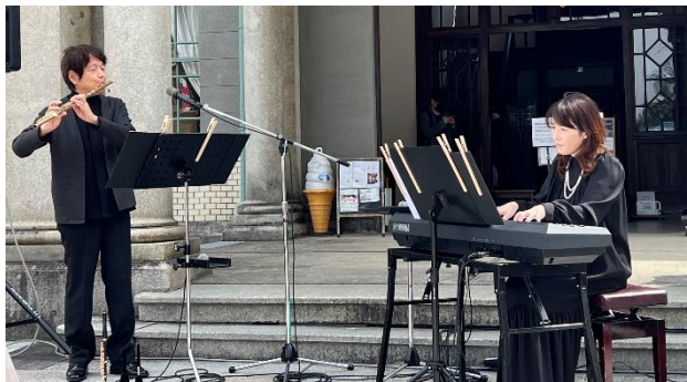
(コンサートイメージ @天神中央公園)