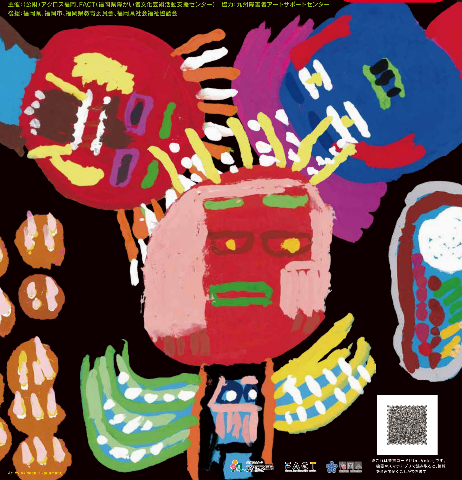
Art by Akinaga Hikaru(maru)

主催:(公財)アクロス福岡、FACT(福岡県障がい者文化芸術活動支援センター) 協力:九州障害者アートサポートセンター 後援:福岡県、福岡市、福岡県教育委員会、福岡県社会福祉協議会