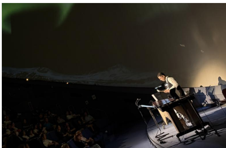
令和7年度アクロス・ミュージックキャラバン in 福岡県青少年科学館 より

アクロス・ミュージックキャラバンは、文化活動の活性化を目的に、アクロス福岡が県内の美術館、博物館、科学館等のミュージアム、県内市町村施設や、天神周辺地域の施設と連携して開催するコンサートです。今回は、プラネタリウムと音楽を同時に楽しめる七夕コンサートを開催いたします。