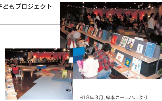
H18年3月、絵本カーニバルより

これまで「旅する絵本カーニバル」の実施が好評の九州大学ユーザーサイエンス機構子どもプロジェクトが、絵本に加え児童文学・詩・評論・写真集・画集など、すべての「子どもの本」をテーマに据えた「子どもの本のカーニバル」を開催する、春休み期間中のスペシャルイベントです。