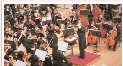
2007年12月のクリスマスコンサート

財団法人 九州交響楽団 福岡県福岡市城南区七隈1-11-50 TEL: 092-822-8855 URL: http://orchestra.musicinfo.co.jp/~kyukyuo