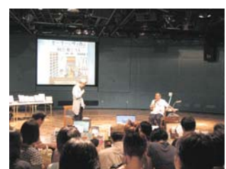
H19年7月、子ども学連続講座より

■お問い合わせ 九州大学ユーザーサイエンス機構子どもプロジェクト TEL092-642-7264