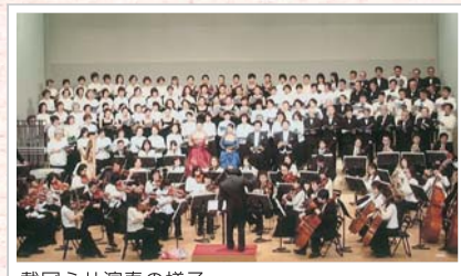
戴冠ミサ演奏の様子

団員は小学生から社会人まで幅広く、若い方々の育成にも努力しております。3月の親子ふれあいコンサート、6月の定期演奏会、12月のクリスマスコンサートなど、「市民と共に」をモットーに、オペラ、合唱、子供たちとの共演