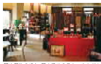
帯や着物のほか、草木染めのストールなども展示・販売されている博多織献上館

博多織の帯や着物はもちろん、草木染めのストール、また伝統の献上柄を織り込んだウエディングドレスも展示。会場では草木染めの体験もできます(有料)。