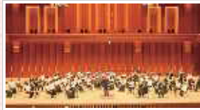
福岡シンフォニーホールでの演奏会の様子

定期演奏会は現在までに15回を数えますが、15回からは我々の憧れだった「アクロス福岡・シンフォニーホール」に会場を移し、すばらしい