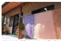
帯や袴など天然染料にこだわった草木染め、ふんわりとやさしい色に染まる

染料の材料は、桜、ざくろ、栗、藍など。工房ではちょうどシフォンのように繊細な生地が、淡い桜色に染められているところだった。オリジナリティが高いと評判の博多織のストールは、県内の百貨店などで手に入るが、昨年7月、西村織物の敷地内に完成した「博多織献上館」でも展示・販売されている。色落ちなどには重ね染めを施すなどのアフターフォローも行き、希望者には博多織や草木染めの工程も見学させる。