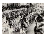
昭和40年の「博多どんたく」(福岡市博物館蔵)

5月1日(木)~4日(日・祝) ■10:00~18:00 ■会場:2階 交流ギャラリー 主催:(財)アクロス福岡