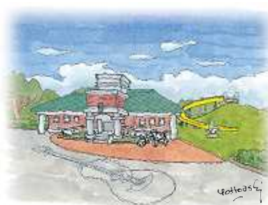
市役所にはほど近いところにある、大川中央公園のトイレと、マンダリンの丘。トイレの建物内に入るとセンサーが反応し吉音メロディが流れる。