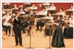
2つのフルートのための協奏曲ソロ演奏の様子

フルート属楽器だけでオーケストラを編成するには、低音楽器の充実が不可欠です。そこでこれらの増備に努め、現在は個人持ちや借用分を含めフルート6本、バスフルート6本、Fバスフルート1本(日本フルート協会九州部会より借用)、コントラバスフルート2本にまで編成が増え、フルートオーケストラの世界を楽しんでいます。