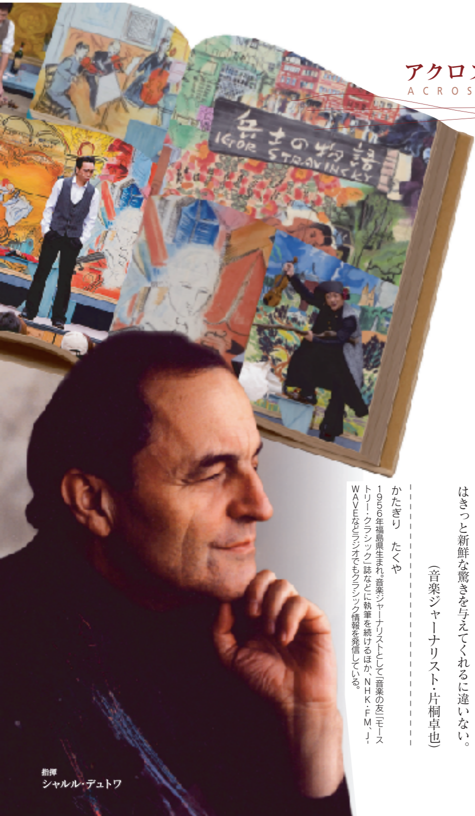
指揮 シャルル・デュトワ