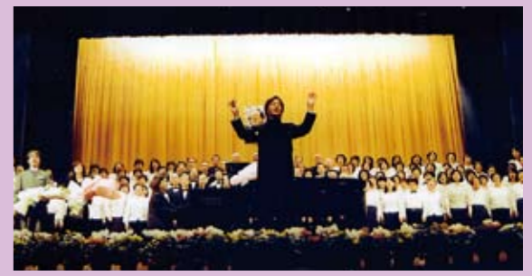
「筑後川」中国公演より

もう7年も前のことになるのだろうか。夏の家族旅行に皆の反対を押し切って北海道・知床に行った。羅白のひかりごけを見る為である。