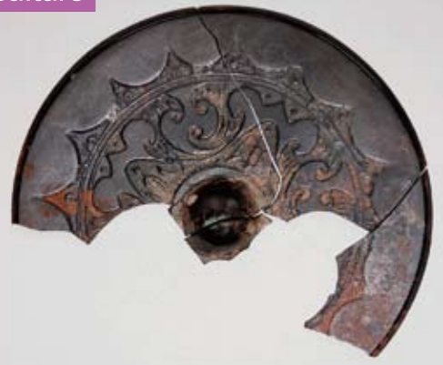
粕屋町・酒殿遺跡出土の変形獣首鏡