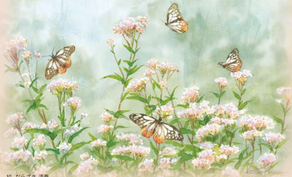
絵 ならさき 清春

市内に水彩画教室を2つ持つ。著書に画集「水彩で描くやわらかな光の風景」東京・大阪・仙台でも水彩画講座を開く。http://park17.wakwak.com/~pict/ アトリエ：福岡市中央区黒門6-41-503 連絡先：092-721-6616