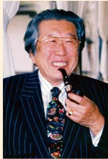
團伊玖磨 (2001年3月29日撮影)

『筑後川』は大河の流れが人の一生になぞらえられるように丸山豊によって作詞され、初演から40年