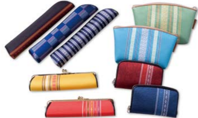
加工品に合った柄、見え方で考えられた美しいデザイン

し、密度のある経糸に太糸を織込む事により、厚手でしなやかな強さを備えた博多織。当初、商品に合った生地づくりは大変だったそうで、長期にわたる織り機の調整が行われました。「博多織の最大の特長と言えば、その丈夫さにあります。しかし、ネクタイや小物入れなどへ加工するのに生地の堅