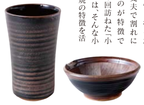
黒の釉薬に施された「飛び鉦」のピアカップとすり鉢

江戸前期に生まれ、素朴な味わいが人気の小石原焼。「飛び鉦」や「刷毛目」などの幾何学的な装飾が施され、「用の美」を追求した焼物として広く民衆に親しまれてきました。 小石原焼は1300℃の高温で焼きしめられるため、丈夫で割れにくいのが特徴です。今回訪ねた「小野窯」は、そんな小石原焼の特徴を活かした