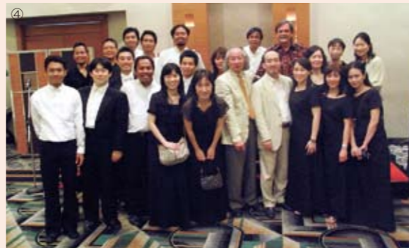
東京シティ・フィル(TCPO)・ヌサンタラ交響楽団(NSO)交流コンサート 2008年6月9日、10日(パライ・サルビニ・コンサート・ホール) ①交流コンサートの様子 ②インドネシア伝統舞踊とのコラボレーション ③ステージには日本インドネシア友好50周年のロゴ ④演奏終了後の両楽団員の笑顔