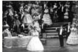
▲椿姫より「乾杯の歌」のシーン (藤原歌劇団公演・1990年)

『リゴレット』の中でマントヴァ侯爵が歌う「女心の歌」、『椿姫』の「乾杯の歌」、『アイダ』の第2幕第2場の「凱旋の場」など、思わず聞き惚れてしまう名曲ばかり。特に今日のサッカー界には欠かせない曲となった『アイダ』の「凱進行進曲」には、天国のヴェルディもさぞ驚いていることでしょう。