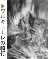
ワルキューレの騎行

まずワーグナーですが、トランペットのファンファーレで始まる有名な行進曲で知られる『タンホイザー』、結婚式には欠かせない「婚礼の合唱」がある『ローエングリン』、「ワルキューレ」や「神々のたそがれ」を含む4連作『ニーベルングの指環』などの大作を含め、すべての台本を自ら書いたばかりか、指揮や演出を始め、美術、大道具、小道具などの舞台関係にもタッチしたり、自分のイメージに合った音の世界を構築するために「ワーグナー・チューバ」という楽器を開発したりといったマルチタレントぶりを発揮しています。