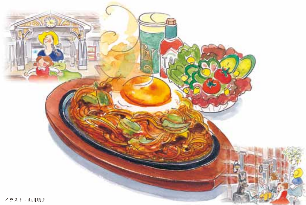
イラスト：山川順子