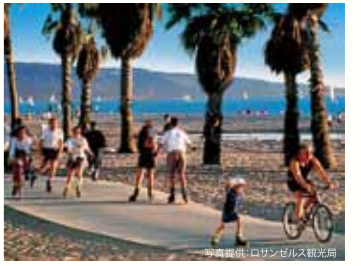
(左上) ホール内。座席はカリフォルニアカラーでリーフ模様を描かれている。 (右上) 同敷地内に建つドローシー・チャンドラー・パビリオン。ロサンゼルス・オペラの本拠地でもある。 (左下) 故リアン・ディズニーに敬意を表し作られた噴水。テルト磁器でバラを象っており、いずれも彼女が愛したものである。 (右下) ロングビーチ