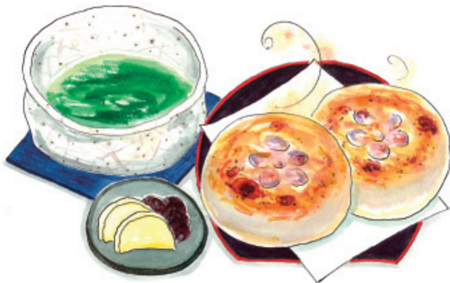
イラスト：山川順子

「たけらぶりの表記について」 歴史上の役所は大宰府、行政上の地名等については太宰府と書くことが慣用化されています。