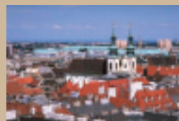
▲ウィーン歴史地区

オーストリアの首都ウィーンは、古代ローマ時代からの歴史を持ち、2001年に世界遺産に登録された。旧市街には様々な時代の様々な建築様式の建築物が現存する。近世以降は、「音楽の都」として、ヨーロッパ文化史上で重要な役割を果たしている。