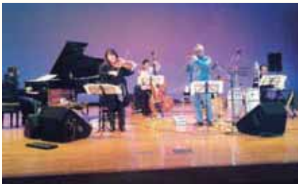
2011 レインボーコンサート in 苅田