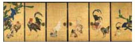
伊藤若冲筆「仙人群鶏図」大阪・西福寺蔵