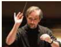
指揮/ゴロー・ベルク 「聴き逃さない指揮者」(音楽の友)今最も注目されている指揮者の一人。

🎵 チャイコフスキー: ピアノ協奏曲 第1番 ベートーヴェン: 交響曲 第7番 ほか