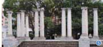
① 階段 ② 階段手摺り ③ 休憩室天井 ④ レストランのアルコーブ ⑤ 旧福岡県庁玄関部分

福岡の近代様式建築*1にはいくつかの系統があるが、建築家三条栄三郎(福岡県技師)が関与した一連の公共建築もその一つである。西欧化を推進した明治政府は共進会(勸業博覧会)を開き、その折に皇族の宿泊施設としてこの建物を造らせた。ボザール*2から多くを学んだ三条は博覧会の華としてこの建築を設計した。