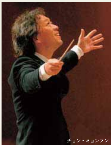
チョン・ミョンファン