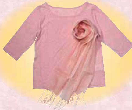
MAITO桜染クルーネック七分袖スカーフ

●「受け継がれる伝統」は、福岡県内の市区町村が指定、支援をする、民芸品を紹介するコーナーです。