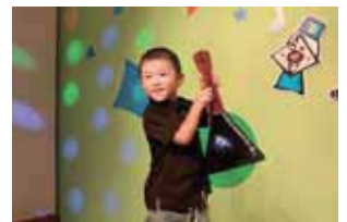
マウンテンギター