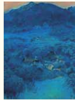
はやみましの 速水御舟《洛北修学院村》 大正7(1918)年 絹本着色 滋賀県立近代美術館所蔵

◆展覧会 「近代から現代へ 日本画の巨匠たち」 —名作でたどる日本美術院のあゆみ— 福岡市美術館にて 8月21日(火)～9月23日(日)まで開催