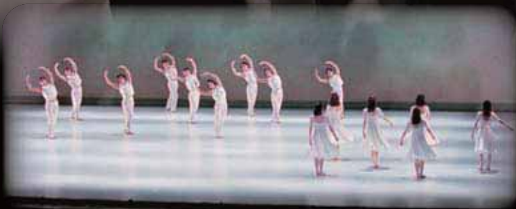
「スプリング・アンド・フォール」 SPRING AND FALL