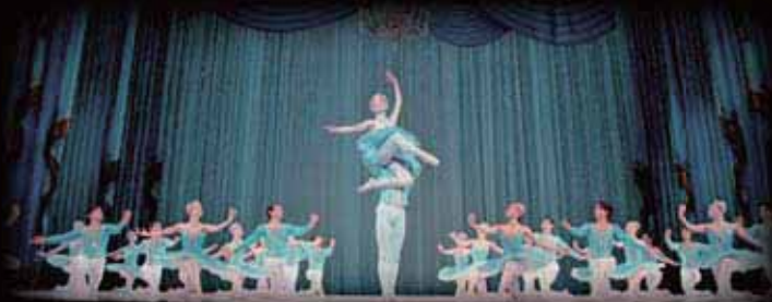
「テーマとヴァリエーション」 THEME AND VARIATIONS