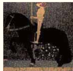
グスタフ・クリムト 《人生は戦いなり(黄金の騎士)》1903年 愛知県美術館蔵

◆展覧会 「生誕150年記念 クリムト 黄金の騎士をめぐる物語」 長崎県美術館にて 平成25年2月22日(金)~4月7日(日)まで開催