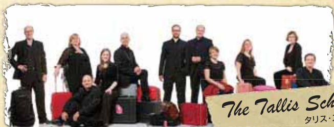
The Tallis Scholars タリス・スコラース