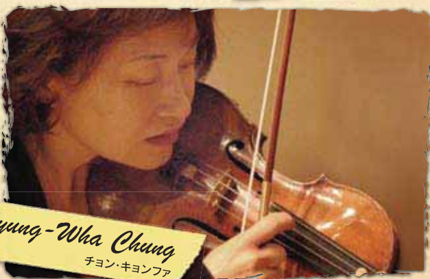
Kyung-Wha Chung チョン・キョンファ