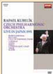
発行・販売： NHKエンタープライズ (c) 2008 NHK

ブラハでは毎年「ブラハの春音楽祭」が行われるが、そのオープニング・コンサートはスメタナの命日に合わせて5月12日に決まっている。そしてそこで演奏されるのがスメタナの傑作『我が祖国』である。この音楽祭の主役はチェコ・フィルハーモニー管弦楽団だが、その他のブラハのオーケストラも参加している。そして、このオープニング・コンサートでの指揮を担当することは、指揮者にとって最高の名誉とされている。「ブラハの春音楽祭」の第1回は名指揮者ラファエル・クーベリックが音楽面を指導した。そのクーベリックは第二次世界大戦後にチェコが共産党政権になるとイギリスへ亡命した。しかし民主化革命の後、1990年に「ブラハの春音楽祭」に復帰し、『我が祖国』を指揮した。そしてチェコ・フィルと共に日本を訪れ『我が祖国』を演奏してくれた。その時期の演奏は現在DVDで観ることができるので、ブラハ放送交響楽団の演奏と合わせ、ぜひチェックしてほしい。