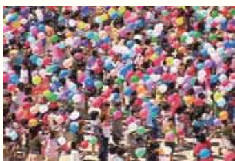
▲田中功起「For Every Daydreaming」2002

「CAMKコレクション展vol.4 来た、見た、クマモト！」 5/29(水)～6/23(日)まで熊本市現代美術館にて開催