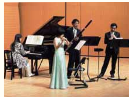
2012レインボーコンサート in 筑前