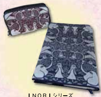
INORIシリーズ キーホルダー(上)・ブックカバー(下)

●「受け継がれる伝統」は、福岡県内の市区町村が指定、支援などをする民芸品を紹介するコーナーです。