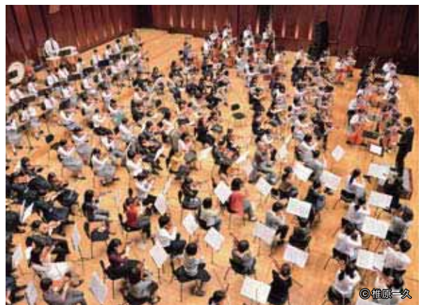
自由演奏会2012「ストリングス・カーニバル」 (2012年10月・福岡シンフォニーホール)

この原稿が読まれる頃には、2020年のオリンピック開催地も決まっているかもしれないが……そのときは、はたして、どんな芸術祭で、どんな音楽が奏でられるのだろうか……？