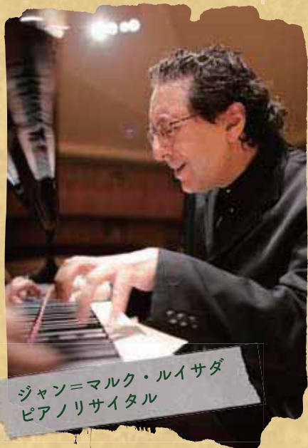
ジャン＝マルク・ルイサダ ピアノリサイタル

＊11月20日東京フィルハーモニー交響楽 団「トリスタンとイゾルデ」は次号特 集でご紹介いたします。