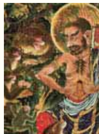
狩野一信「五百羅漢図」第30幅 六道畜生(部分)/増上寺所蔵

◆ 展覧会 大本山増上寺秘蔵 五百羅漢図 ―幕末の鬼才 狩野一信― 10月10日(木)~12月8日(日)まで 山口県立美術館にて開催