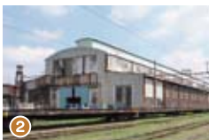
①1910年ごろの修繕工場の作業風景。蒸気機関車の修理も行っていた。