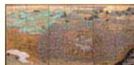
朝鮮軍陣図屏風 公益財団法人鍋島報効会蔵

これまであまり語られることのなかった、大名たちの朝鮮出兵(文禄・慶長の役)をテーマにお話しします。主人公は佐賀藩の基礎を築いたことで知られる鍋島直茂。佐賀の将兵たちとともに歩んだ7年間の戦いの軌跡を絵画史料や書状などからたどることで、朝鮮出兵の実像に迫ります。