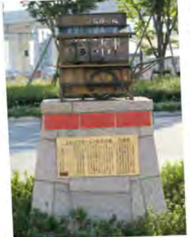
ラーメン屋台のモニュメント (JR久留米駅前)

世界的にも知名度が上がってきたとんこつラーメン。多くの人は「とんこつラーメン=博多」と思っているみたいだけど、実は、とんこつのルーツは久留米にあるらしい。1937年、