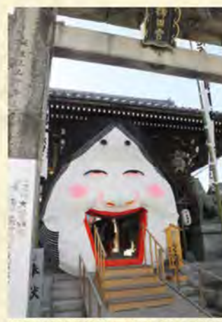
櫛田神社の節分厄除大祭で登場する日本一のお多福面。博多っ子にはすっかりなじみだ

節分の季節になると博多の総鎮守、櫛田神社には日本一のお多福面が登場する。お多福の口をくぐって参拝すると福が訪れるというこの「福くぐり」の発案者が、伝説のプランナー・田中諭吉だ。新聞社や広告代理店勤務時代に実にさまざまな博多の祭事を企画し、その中には今なおこの町に生き続けているものも多い。例えば、700余年の歴史を誇る博多祇園山笠。それまで、博多地区を出たことがなかった山笠を福岡エリアにお披露目するとい「集団山見せ」を企画し、成功させたのも田中だ。それと同時に櫛田神社での常設飾り山笠も実現させた。神事ではあるものの、観光客にも楽しんでもらおうと昭和37年に田中の