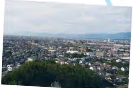
大観音像からの眺望

高さ62m!日本最大級の救世慈母大観音像がシンボルの成田山久留米分院。肩間に3カラットのダイヤモンド18個をつけ、13mの幼児を抱き、穏やかな笑みを浮かべて久留米の街を見守るかのようそびえ立つ大観音像は、今から30年ほど前に当時の久留米市長をはじめ信者たちの協賛で総工費20億円をかけて建立されたんだって!拝観料500円を払うと、救世慈母大観音像の胎内にある284段のらせん階段で肩のところまで上って久留米市街が一望できるよ。