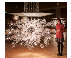
今年1月の定期点検の際に並んでみました。人の背丈ほどの見事なボリューム! シャンデリア総サイズ/高さ3m、幅2.2m

このシャンデリアは上から下へと三部構成になっています。 上部は流れる滝をイメージ。真ん中の水平なガラス板は、実は音を反響させる役割を兼ね備えています。そして客席から見える下部は花火やスターバーストをイメージし、クリスタルビーズが木の幹と枝のように構成され、ホール全体に音を拡散させる機能も併せ持っているそう。ぜいたくな時間を輝きで演出してくれる上、しつかりと音響面にも配慮された設計は、次回ホールにお越しの際にはぜひチェックしてみてくださいね。