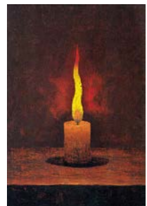
高島野十郎「蠟燭」福岡県立美術館蔵

この講座では、その独特な世界を形作る秘密をご紹介します。野十郎作品に初めて触れる方にもより深く作品を味わうためのヒントをお話しします。