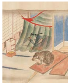
芸州武太夫物語絵巻 / (公財)立花家史料館蔵

柳川藩主立花家に伝来した「芸州武太夫物語絵巻」は、稲生平太郎(後の武太夫)が、寛延2(1749)年に体験した話を元にしています。平太郎の体験談は、「稲生物怪録」の名で広く知られ、今にいたるまで、さまざまな形で紹介されてきました。この講座で紹介する絵巻は、江戸時代後期の作で、丁寧に描かれた挿絵は、文章を忠実に表現しています。殿さまや姫さまが楽しんだオバケの絵巻を、皆さんと一緒に繰り広げながら、意外な結末をむかえる平太郎の30日間を解説します。