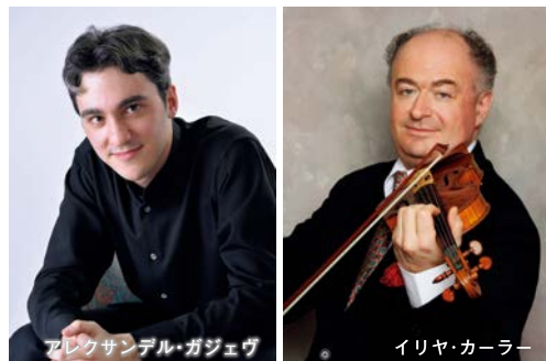
アレクサンデル・ガジェヴ