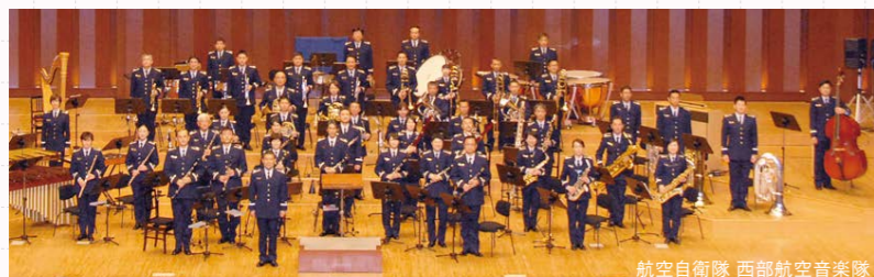
航空自衛隊 西部航空音楽隊

※主催者の希望または作成日の関係等により本誌に掲載していないイベントもあります。また諸事情により掲載内容が変更になることがあります。ご了承ください。 ※本誌記事・写真・レイアウトなどの無断転載、複製、引用を固くお断りします。