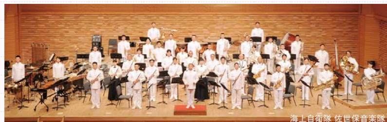
海上自衛隊 佐世保音楽隊