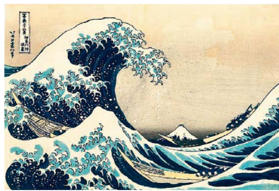
葛飾北斎「富嶽三十六景 神奈川沖浪裏」

開館以来、成長を続けてきた山口県立萩美術館・浦上記念館の東洋陶磁と浮世絵のコレクション。特別展示「やきものでわくわく 浮世絵にうきうき 開館20周年記念特別企画展Ⅰ」では、厳選した優品192点(浮世絵と東洋陶磁)を一挙にご紹介します。この講座では、その中でも浮世絵に焦点をあて、黄金時代の鳥居清長、喜多川歌麿、東洲斎写楽をはじめ、その後活躍した葛飾北斎や歌川広重、国芳の作品を中心に、時代ごとに変化する表現、代表的なジャンルといった、基礎的な項目に基づきながら作品解説します。