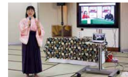
競技かるた名人・クイン戦 インターネット放映及び実況解説