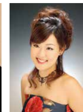
ソプラノ/三宅理恵