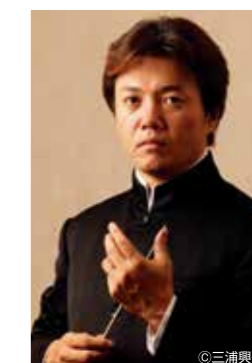
指揮&お話/現田茂夫

📍 福岡シンフォニーホール 🕒 15:00開演 💰 S席5,200円 A席4,200円 B席3,100円 C席1,500円 👤 指揮&お話/現田茂夫 ソプラノ/三宅理恵 ほか 🎵 ヨハン・シュトラウス二世/喜歌劇「こもり」序曲 プッチーニ/歌劇「ラ・ボエーム」〈私が街を歩くと〉 レハール/喜歌劇「メリー・ウィドウ」〈ヴァリアの歌〉 ほか