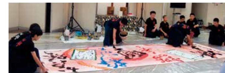
百人一首書道パフォーマンス (第9回より)