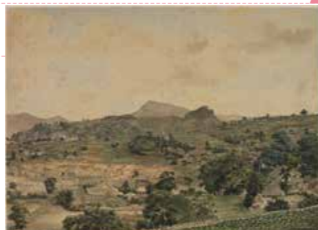
長崎東山手風景図

特別展覧会 没後150年坂本龍馬展 場所/長崎歴史文化博物館 会期/平成28年12月17日(土)~平成29年2月5日(日)