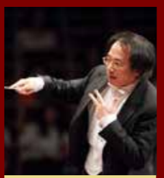
指揮: リュウ・シャオチャ