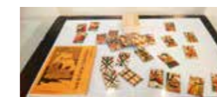
かるたの展示・販売