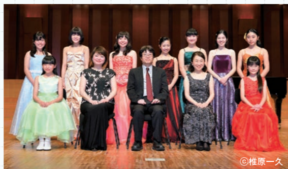
平成27年度スプリングコンサートより

受講期間 平成29年4月～平成30年3月 ※原則として土日2日間/月×12回 (1回45分)