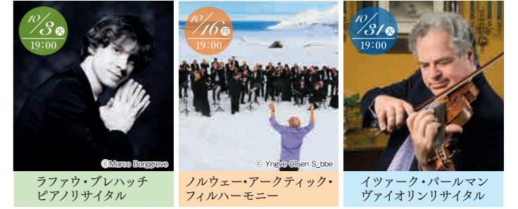
ラファウ・ブレハッチ ピアノリサイタル ©Messa Bergasse ノルウェー・アーケディック・フィルハーモニー ©Yngve Olsen S.ibe イツァーク・パールマン ヴァイオリンリサイタル