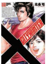
※本誌「シティーハンター」XZ Edition 第1巻「シティーハンター」シリーズ、ステッカー、ポストカード ©北条司/NSP

1985年から91年まで『週刊少年ジャンプ』に連載され、テレビアニメとともに爆発的人气となった「シティーハンター」。同作品のイラストパネルなどを解説付きで展示し、今夏開催の展覧会の見どころと併せてご紹介します。