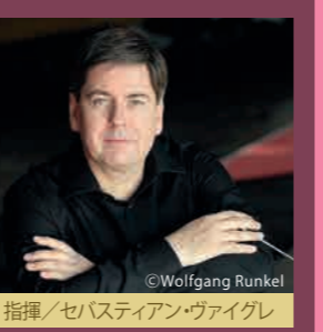
指揮/セバスティアン・ヴァイグレ