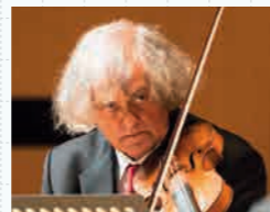
シギスヴァルト・クイケン