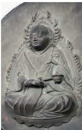
彦山三所権現御正体のうち 天忍穂耳命像 (英彦山神宮所蔵)

英彦山は、福岡県と大分県にまたがる、大きく個性的な姿をした霊山です。山の頂は、北岳、中岳、南岳の三つの峰に分かれていて、それぞれの峰には、天忍穂耳命、伊弉那美命、伊弉那岐命が祀られています。これら三柱の神を中心に、英彦山山内には多くの神々が祀られています。英彦山は古来より知られた神の山なのです。一般に、神像は拝観不可ですが、英彦山修験道館に行けば、拝観可能な神像の名作が居並んでいます。そしてここには、仏像も少なからず存在しています。現在の山内では仏教色は薄らいでいるものの、明治時代の神仏分離や廃仏毀釈を経る以前の英彦山は、仏の山でもあり、これらの仏像はその忘れ形見なのです。この講座では、英彦山山内に伝わる神像、そして仏像を通して、神仏が共生する聖地としての英彦山について紹介します。