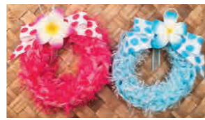
ハワイアンリース

作品展 PUAMELIARIBBONLEI FUKUOKA教室展 ※作品展の詳細はP7をご覧ください。