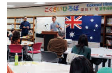
こくさいひろばカフェ

◆「こくさいひろばカフェ」 ※奇数月開催 vol.41「ルワンダ&ガーナ」 9月24日(日)14:00~16:00 参加費:300円(賛助会員は無料) 【お問い合わせ】 (公財)福岡県国際交流センター こくさいひろば TEL.092-725-9200 http://www.kokusaihiroba.or.jp/