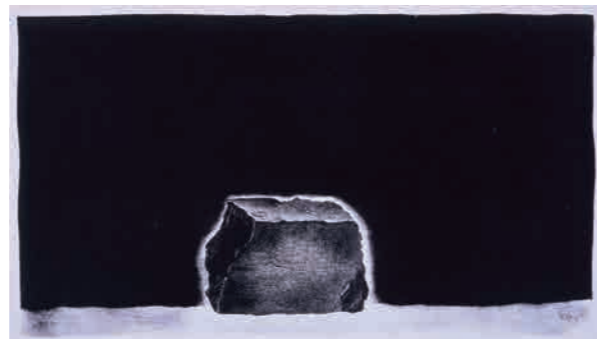
殿敷侃 《ドームのレンガ》1977年、銅版・紙 (下関市立美術館蔵)

1942年、広島市生まれ。原爆投下後の広島市内に入り、二次被爆する。20歳頃、入院中に絵を描き始め、国鉄で働きながら制作を行う。1972年に国鉄を退職し、山口県長門市へと移って本格的に制作に打ち込む。当初は絵画と版画を中心とするも、1980年代前半からは廃材を使用したインスタレーションに取り組む。1992年、50歳で逝去。