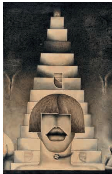
殿敷侃 《無題》1970-71年、インク・紙 (下関市立美術館蔵)

展覧会 所蔵品展No.139 / 殿敷侃 — 僕は夜明けを信じた 場所 / 下関市立美術館 会期 / 2018年1月5日(金)~2月25日(日)